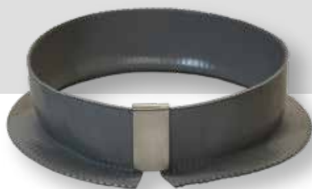
MOLDS STOPPER EC/CE MOLDE STOPPER EC/CE