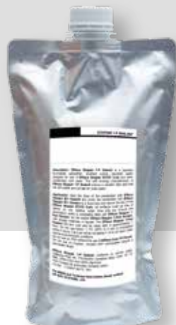
STOPPER SEALANT M-1 SELANTE STOPPER 1-P